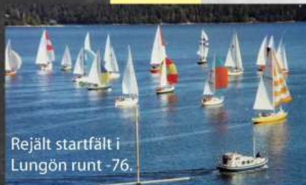
Rejält startfält i Lungön runt -76.