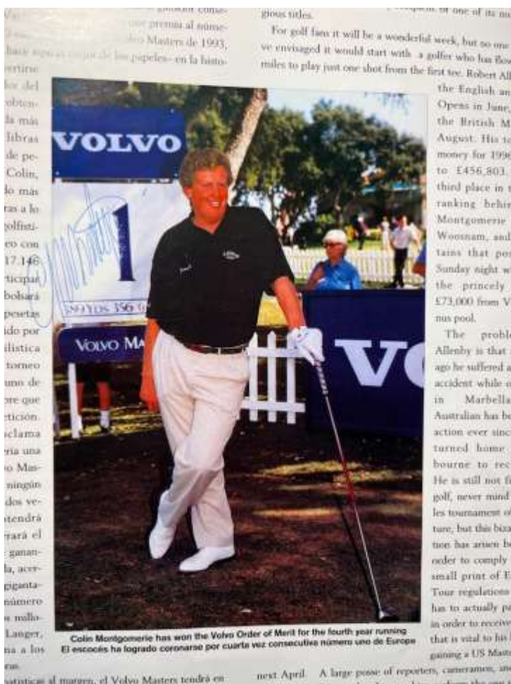
Montys autograf syns vid siffran ett på vänstra bilden och Ballesteros mitt på pappersarket på högra bilden.