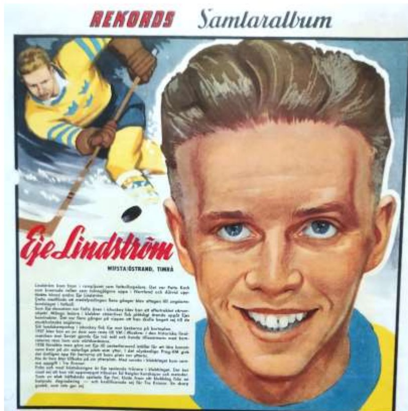
Rekordmagasinet nr. 10 1960

Vi har, av en son till Wille, fått tillgång till ett antal bilder från Härnösandsposten år 1949 och några av dessa har vi valt ut för publicering.