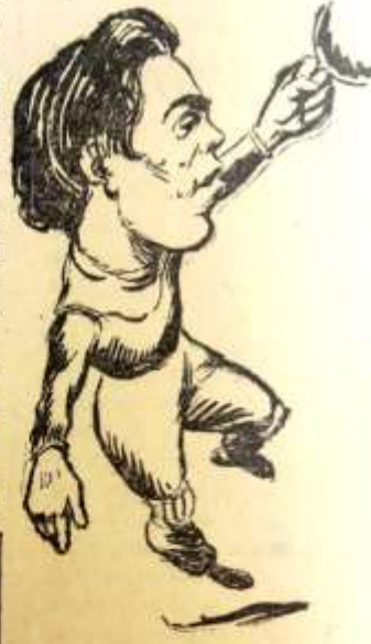
»Zamora» välkommen i fadershuset.

gångsrik stopper. Vänstersidan i anfallet var helt till sin fördel.