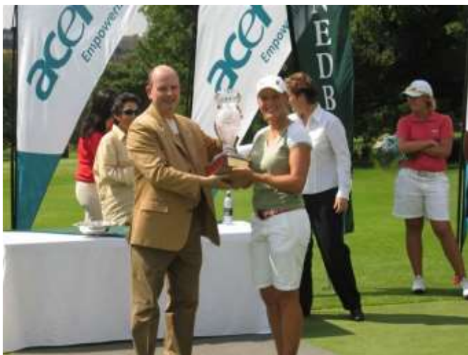
1:a South African Womens Open 2005