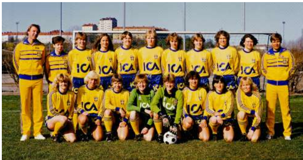
Landskampsdebut vid 17 års ålder mot Danmark. Det skulle bli ytterligare 111 matcher i den blågula landslagsdräkten innan karriären var över för världens bästa målvakt.

- Till Malmö kom jag egentligen som målvaktstränare, men eftersom deras ordinarie målvakt i samma veva beslutat sig för att sluta så fick jag en fråga om jag inte kunde tänka mig stå.