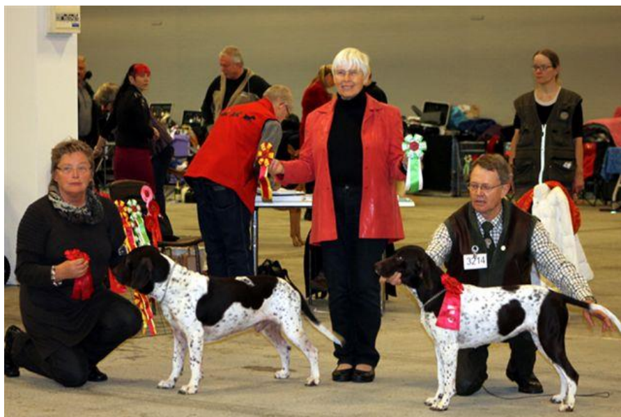
Udstilling i Herning